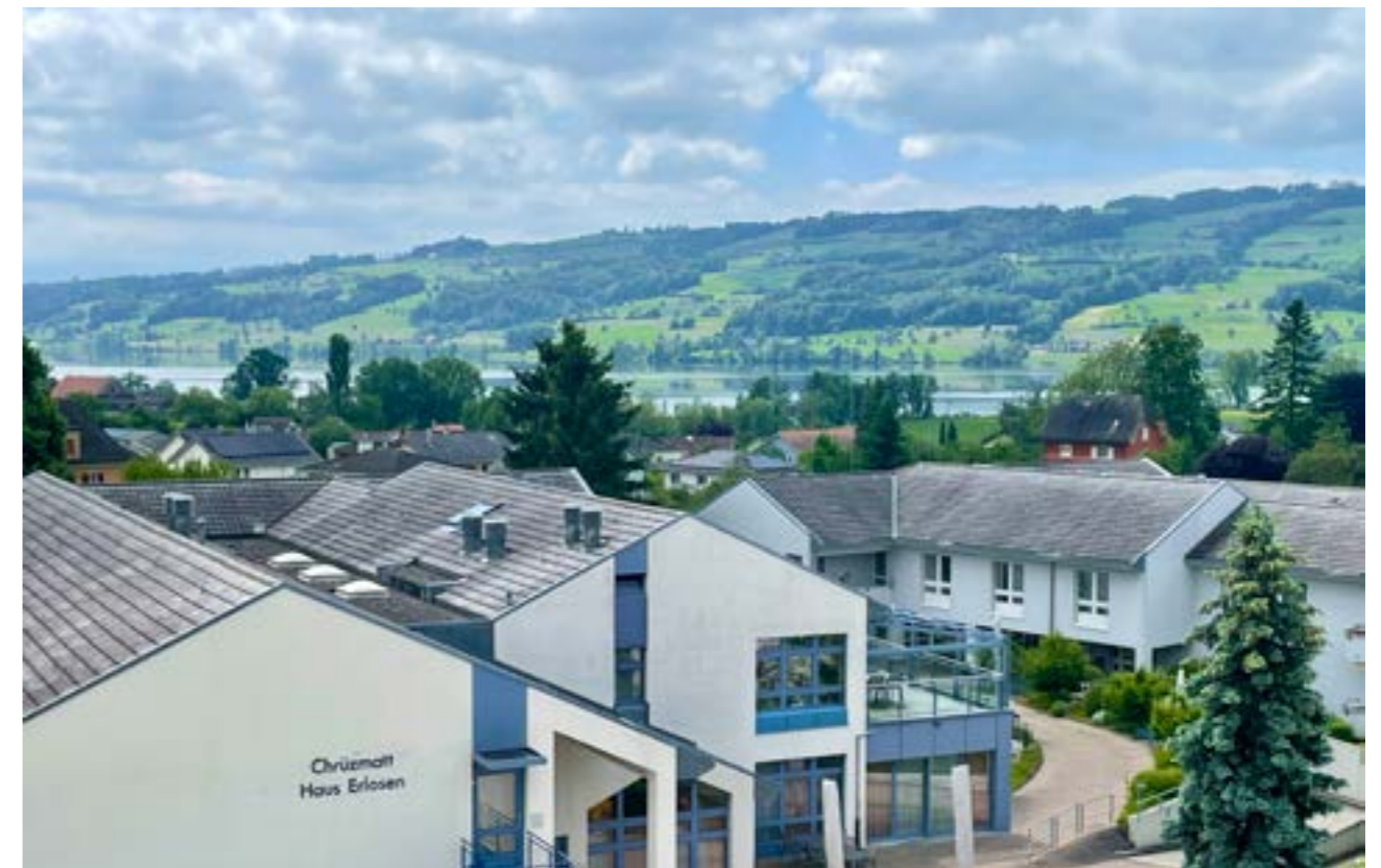
Aussicht aus dem Haus Lindenberg